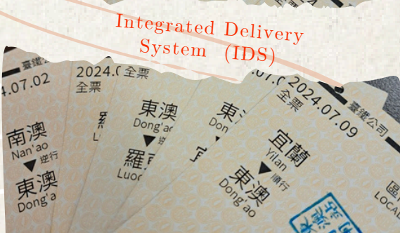
Integrated Delivery System (IDS)

回顧那兩周：見習的課程大致分為附醫藥劑部、醫院門診跟診見習與IDS服務。在院內印象最深刻的，是在臨床藥學端和學姊一起進入ICU查房。早上剛踏入加護病房，就見各個醫護人員開始戰戰兢兢的進行交班，對我而言甚是震撼。接著查房時，我透過病房窗外看見一望無際的蘭陽平原，但眼前躺臥在病床上的婦人，卻無法睜眼迎接從窗外透入的夏陽。這殘酷的對比映入眼簾，並於我心上刻下了無限地感慨。因為ICU中幾乎皆為中老年病患，其中一位年紀與我相仿的青年，使我格外好奇他的病況。「我有回去看(現場急救)的影片，難怪當下怎感覺心臟忽快忽慢，胸口還悶悶的。原來是大家輪流幫我壓胸呢」。原來病人日前聚餐時因不明原因突然倒地。幸好身旁友人及時接力替他進行CPR；所幸到院後挽回一命，更透過後續檢查發現了心臟罕見疾病。在這短短的一個早上，我不僅對於在ICU隨時待命的醫護人員肅然起敬；看見人類在疾病面前是如此地的微小；更感受到了生命的韌性和人性的光輝。