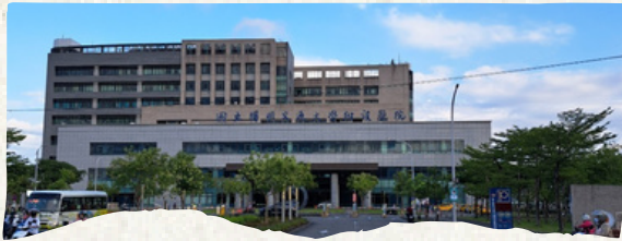
National Yang Ming Chiao Tung University Hospital

在升大三的這個暑假，我鼓起勇氣挑戰並嘗試不同的學習環境與機會：參加了行醫醫定行。行醫醫定行是一門提供醫學系、護理學系與藥學系學生的課程企劃，在暑假期間進入台灣各地基層醫療院所見習及觀摩，深入了解地區醫療與未來的工作場域。