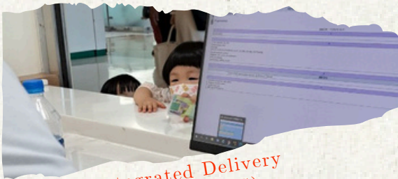
Integrated Delivery System (IDS)